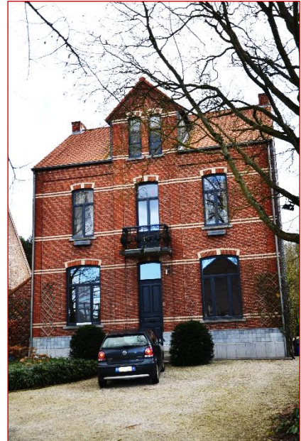
Foto rechts: Het huis in Testelt waar de monseigneur de laatste jaren van zijn leven doorbracht. Foto hieronder: Graf in arduin van de monseigneur in Averbode.

Oud-Apostolisch Vicaris van Denemarken Titelvoerend Bisschop van Roskilde